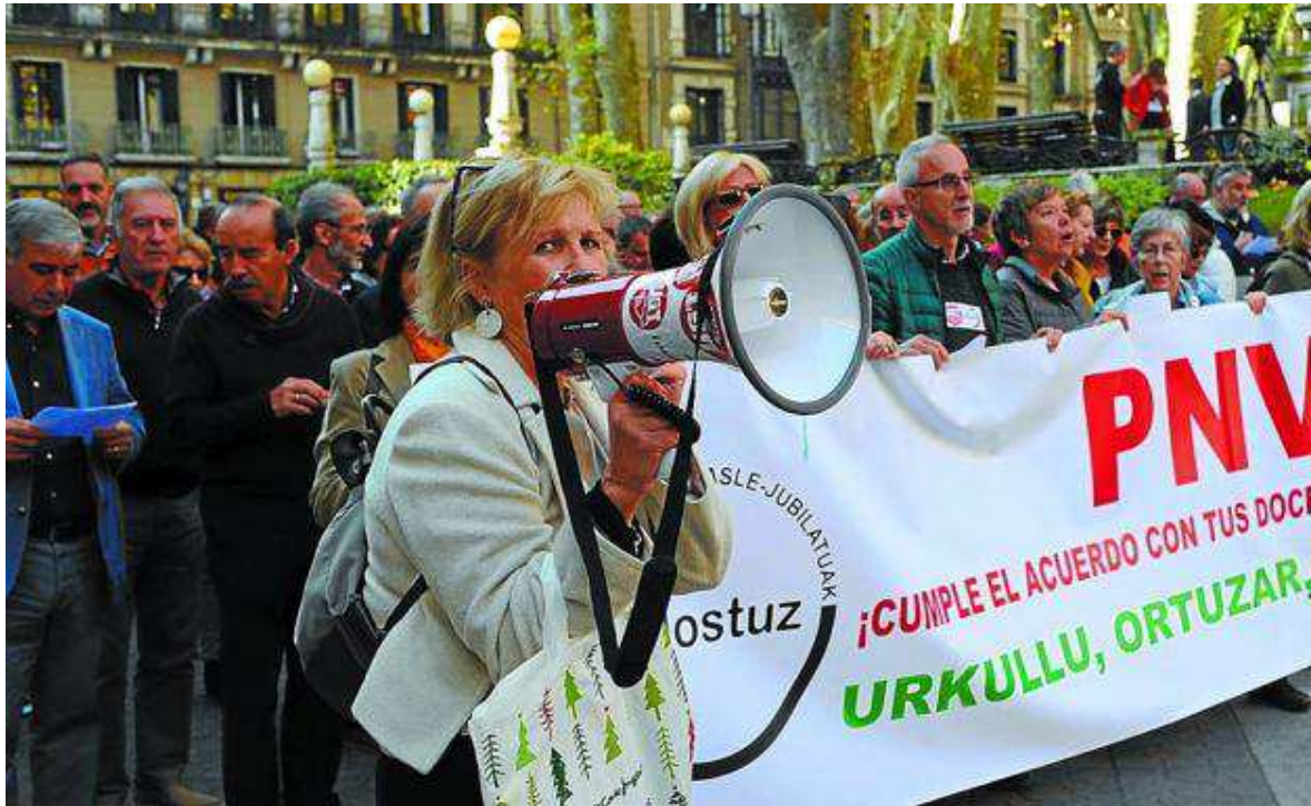
Concentración de docentes jubilados ante la sede del PNV en Bilbao.